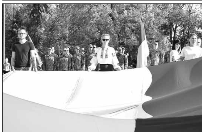
сьогодні в цій залі присутні ті, хто власним прикладом показав силу духу та відвагу українського народу.

Міський голова також згадав усіх воїнів, які зараз перебувають у ворожому полоні та виразив впевненість в тому, що вони повернуться додому. А саму першу медаль «За оборону міста Миколаєва» він вручив генерал-майору Дмитру Марченку, який в найбільш критичний момент наприкінці лютого 2022 р. очолив оборону міста.