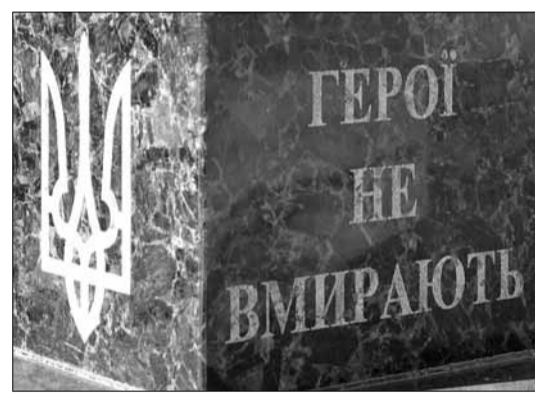
миколаївці зможуть запропонувати якісь зміни чи ідеї, - сказав Олександр Сенкевич.

Як відомо, Алею пам'яті планують облаштувати у 2024 році. Там пропонують встановити цифрові пам'ятники загиблим військовим, де можна буде дізнатися про історію загиблих героїв за допомогою сканування QR-коду на меморіальних дошках.