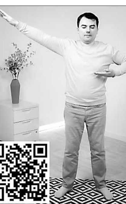
Фалуньгун - це один із простих і безплатних методів оздоровлення. Він поширений по всьому світу. В Ук-

Наше сьогоднішнє - це справжній виклик для українців. Чимало жителів країни через війну втратили домівки, роботу, бізнес, у когось розлучені сім'ї. У великій кількості людей фактично відсутня точка опори і джерело відновлення внутрішньої енергії. Уся нація перебуває в стресовій ситуації, тому для нас, як ніколи, важливо віднайти в собі сили й натхнення до життя.