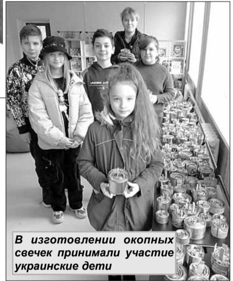
В изготовлении окупных свечек принимали участие украинские дети