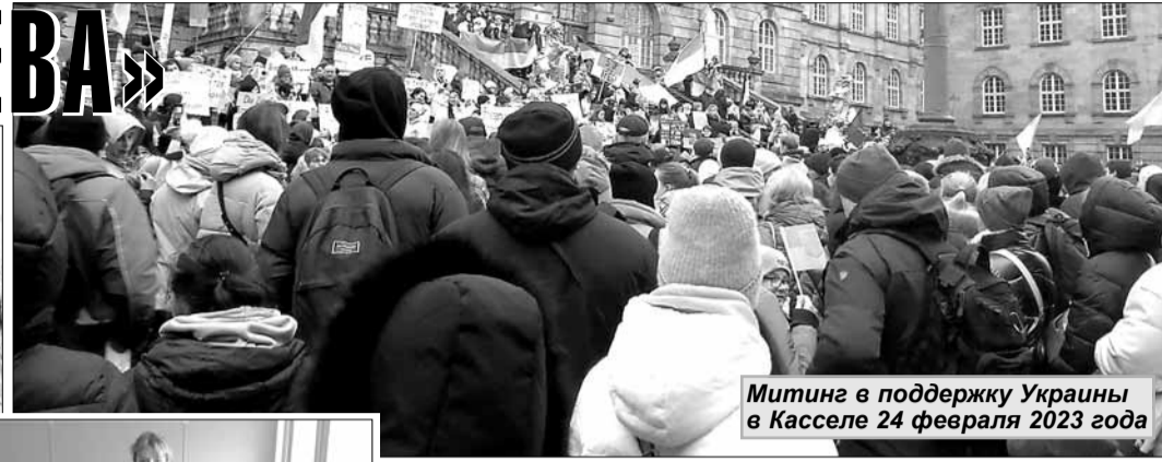
Митинг в поддержку Украины в Касселе 24 февраля 2023 года