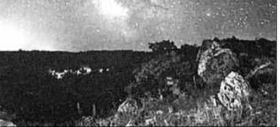
природному парку «Сланецький степ», на чорноморському узбережжі. Справний патріот рідного краю, він активно співпрацював з НПП «Бузький Гард», допомагаючи в організації природоохоронних та еколого-освітніх проектів.