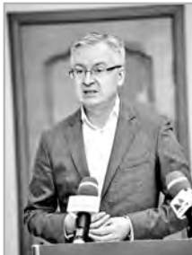
Також команда директорів КП «Миколаївводоканал» відповіла на численні запитання журналістів.

на водоканалах, які передано у концесію. В ідеалі наші доходи повинні дорівнювати витратам, – наголосив він. – Основні статті витрат електроенергії, заробітна плата, паливно-мастильні матеріали, матеріали для ремонту мереж, реагенти, інвестиційна складова, виплата за кредитами... За результатами господарської діяльності за рік у нас немає заборгованості ani з електроенергії, ani з заробітної плати та витрати відсотків за користування кредитними коштами.