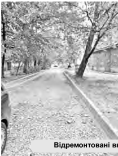
Відремонтовані внутрішньоквартальні проїзди