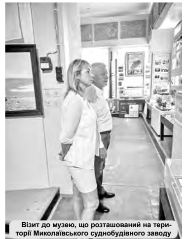
Візит до музею, що розташований на території Миколаївського суднобудівного заводу