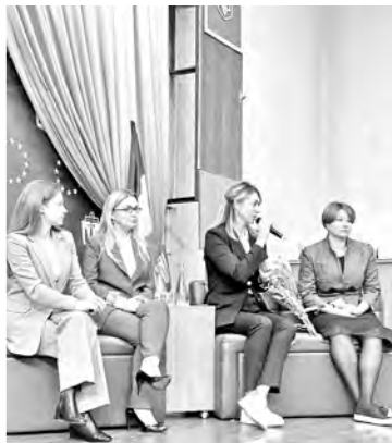
Зустріч з народними депутатами України Оленою Мошенець та Маринною Бардіною