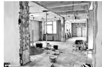
Тут будут расположены 3-4 инкубатора для новорожденных, к которым подведут кислород, - объясняет Олег Ищенко.

Добавим, что перинатальные центры оказывают высококонцентрационную помощь беременным, рожающим, больным новорожденным и детям с крайне низкой массой тела при рождении.