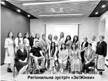
Регіональна зустріч «Зе!Жінки»

— До речі, Ви досить реально слідкували за роботою КОПУ, висвітлювали свою позицію у соціальних мережах та надавали коментарі ЗМІ. Якщо не помиляюсь, то навіть ініціювали звіт керівництва підприємства. Як успіхи у цьому напрямку? — Повторюсь, що для мене дуже важливо, аби наші діти мали якісне, повноцінне та здорове харчування. Саме від роботи КОПУ залежить якість дитячого харчування, й, звісно, я ретельно слідкую за його роботою. Мені вдалося отримати звіт керівника КОПУ за 100 днів його роботи. Це питання було принциповим, адже необхідно було почути, що вже було зроблено для того, щоб покращити рівень харчування наших дітей, та які плани керівництво має на майбутнє. До того ж, до мене звертається велика кількість батьків, чи діти навчаються у дитячих садочках та школах міста. На жаль, усі вони скаржаться на погану якість харчування. Чи сподобалася мені відповідь керівника КОПУ? Звісно, що ні. За час його роботи можна було сказати бодай якісь результати, проте я й досі продовжую отримувати негативні звернення від батьків та прохання допомогти вирішити це питання. Мені не можуть задовольнити слова, потрібно