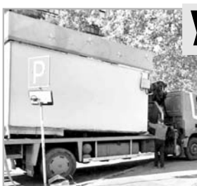
Сотрудники департамента внутреннего финансового контроля, надзора и противодействия коррупции Николаевского горсовета продолжают работу по очистке городской территории от незаконных сооружений.