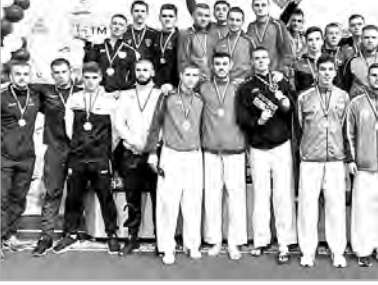
ЧЕМПИОНАТ УКРАЇНИ З КАРАТЕ 2021 РІК