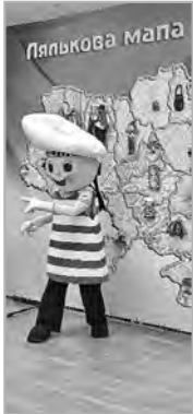
Дялькова мапа. Магнітами. Серед них – мариупольський металург, луганський галушка, іжевський мальчишка-бараник, чернігівський котфей, кримський дельфінчик, херсонський арбузик, ніко...