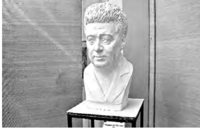
областной филармонии. Открыл персональную выставку директор Николаевского областного художественного