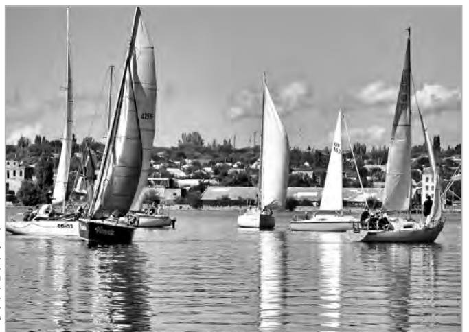
Регата является традиционной для нашего города. Участие в ней в этом году приняло около 20 николаевских экипажей, объединенных в группы по типам яхт. Традиционно участвовала в регате и легендарная яхта «Икар», спроектированная, построенная в Николаеве в 1987-1988 гг. сошедшая с конвейера «Солнечная парусная».

Со Спасского рейда (район областного яхт-клуба) в минувшие выходные с соблюдением всех карантинных норм стартовала шестнадцатая по счету «Янтарная парусная регата Святого Николая», посвященная Дню города. А перед этим на территории полюбившегося николаевцам общественного пространства «В Причал» состоялась церемония открытия с участием представителей Николаевской областной федерации парусного спорта и компаний-спонсоров «AB InBev Efes Украина» и ООО «Кворум Нафта».