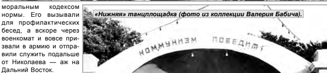
«Нижняя» танцплощадка.

моральным кодексом нормы. Его вызвали для профилактических бесед, а вскоре через военкомат и вовсе призывали в армию и отправили служить подальше от Николаева — аж на Дальний Восток.