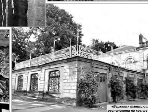
«Верхняя» танцплощадка яхт-клуба расположена на крыше здания эллинга

раннюю свадьбу не шла ни в какое сравнение с жалкими грошами, которые по госрасценкам мог предложить местный клуб или Дворец культуры.