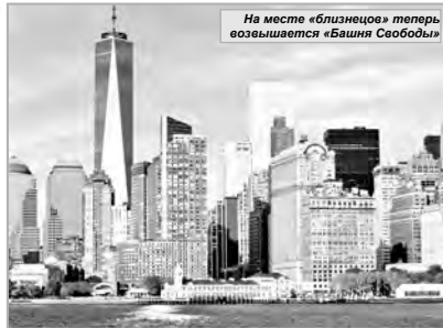
На месте «близнецов» теперь возвышается «Башня Свободы»

В интернете можно найти много информации и о самом масштабном теракте в Нью-Йорке, и о разрушенном им величественном сооружении - Всемирном торговом центре. По нашей просьбе