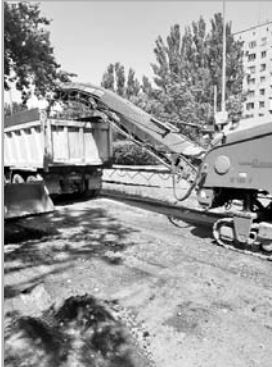
Адміністрація Ингульського району Миколаївської міської ради.

Тож, шановні жителі Ингульського району, будьмо взаємо відповідальними! Лише спільними зусиллями ми зможемо зробити наш район і наше місто чистим та охайним. Будь ласка, дотримуйтеся «Правил благоустрою» та, якщо маєте інформацію про виникнення стихійних звалищ, повідомляйте про це районну адміністрацію за телефоном (0512) 24-71-92, або звертайтеся до Контакт-центру міської ради у мережі «Фейсбук».