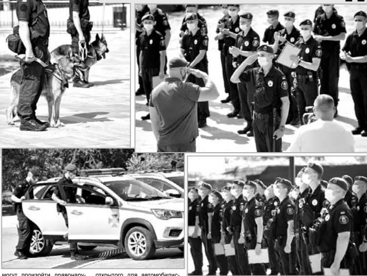
могут произойти правонарушения. Большое внимание бойцы НГУ уделяют охране центральной части города и мостов, в том числе и недавно