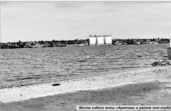
Место гибели яхты «Арктика» в районе яхт-клуба