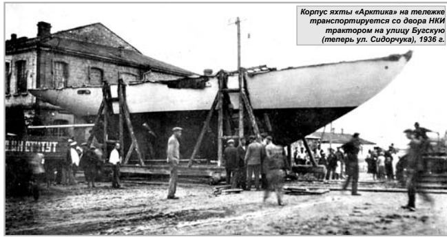
Корпус яхты «Арктика» на тележке транспортируется со двора НКИ трактором на улицу Бусую (теперь ул. Сибиряка), 1936 г.