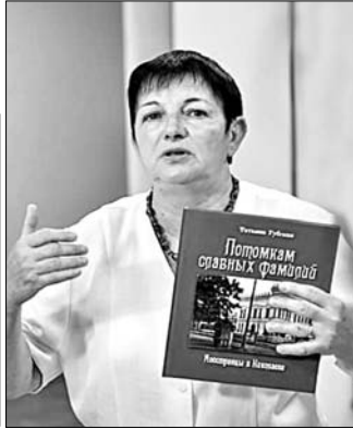
Сегодня идет перевод книги-путеводителя на украинский язык. Однако когда увидит свет новое издание – сказать трудно. Как всегда, главной проблемой остается финансовая сторона вопроса.