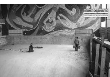
старую керамическую плитку облицовки чаши. Сейчас производится очистка до бетона основания.

Работники подрядной организации уже демонтировали