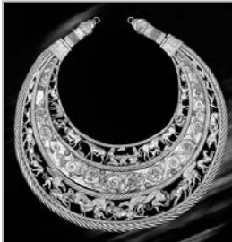
ЗОЛОТА ПЕКТОРАЛЬ У ЦИФРАХ: Период: Стояновья — IV столетия до нашей эры Материал: золото 999 пробы Взвешивание: 150 г Диаметр: 30,6 см Размеры фигур: вид сверху 10х10 мм (когда) Детская технология: операция 10 операций кованой техникой 4 югиты канцона 3 яруса 160 деталей 18 пестельчатых хисок азсгил 500 орнаментов элементов канцона орнамента 4 фигур кобылы 7 палочек 25 тварин 6 грифонов 4 колесца

языковой принадлежности скифов лингвисты сделали на основе анализа имен героев, богов, царей и терминов, известных по античным источникам, — объясняет ученый. Пектораль не поддается, потому что ее авторство неизвестно. Хочется, чтобы это были знаменитые имена, но ни одной зацепки у исследователей нет. Один неоспоримый факт — пектораль сделана греки. Скифы такими сложными технологиями не обладали. Эти народы имели различные мифы и веру, но у них было много общего.