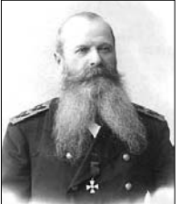
Составила Елена Швеца.