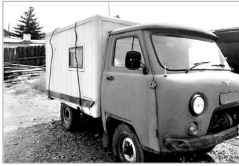
Знакомую коробку на плечи, он поехал в кассу за билетом на Одессу. И тут его ждало разочарование. На дворе июнь, естественно, все билеты на пять дней вперед в Южную Пальмиру давно раскуплены. Заменяла перспектива коротать пять суток в аэропорту с коробкой в обнимку или отправиться домой поездом.

Все необходимые документы для гарантийного ремонта оперативно оформили. Можно было отправить коробку на завод-производитель почтой. Но тогда на пересылку и ремонт ушел бы не один месяц. Чтобы сократить сроки гарантийного ремонта, руководством райотребсоюза связалось с ответственными за гарантийное обслуживание Ульяновского завода имени В. И. Ленина (так тогда назывался Ульяновский завод).