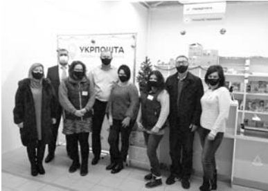
В один из прогжих зимних дней дружный, трудолюбивый и преданный своему делу коллектив отделения почтовой связи города Николаева...