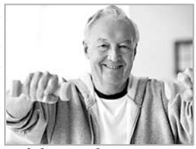
Сгибание и разгибание рук в локтевых суставах. В положении лежа или сидя разведение выпрямленных рук в стороны.