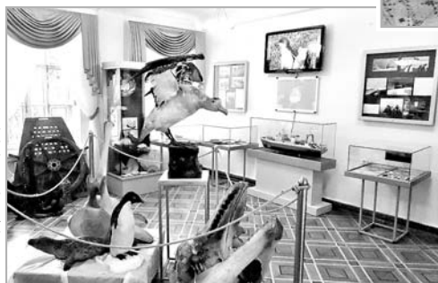
Скопых экосистем, которые «Гринпис» обнаружил во время постоянных экспедиций и призвал их сохранить. Ученые уверены: для того, чтобы защитить дикую природу, необходимо обеспечить продуктивную миллиарды людей и при этом остановить стремительное изменение климата, нам необходимо выделить примерно 30% мирового океана под территорию заповедников.

Антарктида... Этот континент, расположенный на самом юге земного шара, привлекает внимание исследователей со всего мира. Какие тайны хранят эти земли, где не существует ни одного государства, а на полярных станциях живут только научные сотрудники? Какие удивительные открытия спрятаны на южном полюсе холода, где царит вечная мерзлота, полная загадок и тайн?