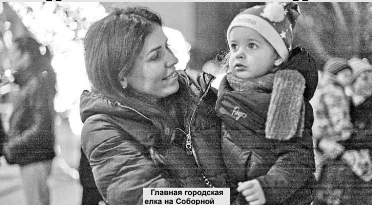
Главная городская елка на Соборной площади в период новогодне-рождественских праздников стала настоящим «местом поклонения» для тысяч николаевцев и гостей города.