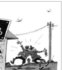
Рисунок И. СЫЧЕВА

Во вторник, 22 декабря, Госдума этой страны поддержала в третьем чтении соответствующий законопроект, пишет «Страна». «Документ дает российским регионам право с 1 января следующего года создавать медицинские вытрезвители «на принципах партнерства с частными организациями». Жаль, тема до конца не раскрыта: с какими именно частными организациями? Медучрежденными? Баними? «Правительство будет определять общие правила организации деятельности таких учреждений» (в смысле, вытрезвителей, прим. авт.). Если вспомнить, что во времена СССР у вытрезвителей была приставка «мед», а теперь ее нет, то трудно сказать, какими же методами будут протрезвлять загулявших