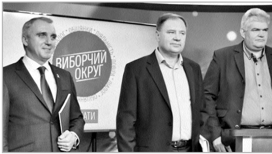
Что вскоре подтвердили результаты выборов.

листкам, пафосно-обличительным публикациям в СМИ, одновременно содержащим сладкие обещания на случай победы, да еще к частому мельканию на ТВ и в интернете с нардепами от ОПЗЖ, приехавшими его поддержать.