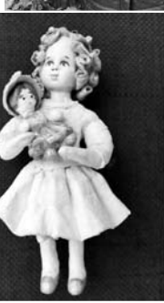
Петровна об истории создания одной из своих замечательных игрушек. Техника изготовления ватной игрушки - лучшее, что придумало человечеством при подготовке к Новому году!