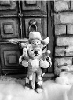
Податливый, удобный в работе материал позволял изготавливать большое количество фигурных, сюжетных игрушек - здоровых румяных мальчишек и конкобежцев, поргничников, полчинок, пионеров, фигурок зверей и персонажей любимых детских сказок.