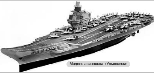
Модель авианосца «Ульяновск»

25 ноября 1988 года на стапеле «ноль» Черноморского судостроительного завода был заложен атомный авианосец проекта 1143.7 «Ульяновск».