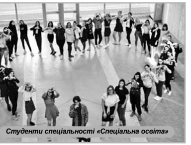
Студенти спеціальності «Спеціальна освіта»

Окрім навчання, студенти-логопеди Миколаївського національного університету активно займаються розвитком своїх творчих здібностей та удосконаленням навичок практичної роботи шляхом організації та