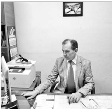
подключение всей школы в зону Wi-Fi. Есть и отдельный беспроводной Wi-Fi для учащихся, с ограничением их входа на развлекательные сайты. Финансирует эту услугу городское управление образования.

Также оборудовали школьные туалеты автоматическими выжимками. Дополнительно поставили 3 рукоятки в столовой, один - в кабинете 111, - благодаря О.Г. Степаненко.