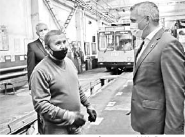
и уроки он преподавал тоже немалые. Какие именно?

Конечно, когда непосредственно оказываешься внутри этого процесса, то намного ближе знакомишься с проблемой. Тем не менее, я и до этого достаточно глубоко вник в суть вопроса. Поэтому всю весну и лето мы готвили к возможному росту заболеваемости: усиливали наши больницы дополнительными койками, работали над приобретением дополнительных ИВЛ-аппаратов, устанавливали кислородные точки, заключали договоры с Национальной службой здоровья, привлекали большой бизнес. Сейчас, например, за окном моей палаты можно услышать звук отбойного молотка – это «Нибулон» модернизирует нашу городскую больницу №1. Скоро откроется новое инфекционное отделение в 5-й больнице, которая находится в Корсабенинском районе. Его строительство стало возможным благодаря помощи Николаевского глинозаводного завода. Работ проводится действительно много. Но если говорить о личном опыте, то я обязательно позже сделаю памятку, как правильно поступать при таком заболевании, чтобы не доводить до больницы койки. Потому как потом за нас берется медицина. И я им полностью доверяю. Пандемия внесла невероятную коррективы в все наши планы и дела. Коронавирус ударил по карманам украинцев. Очень много потерял малый и средний бизнес. Но