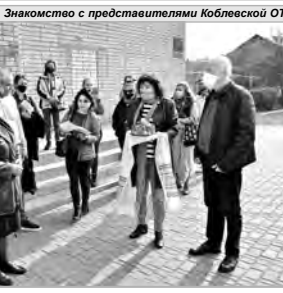
Знакомство с представителями Коблевуцкой ОТГ

— Наше море требует защиты, и мы обязаны его беречь. Поэтому ученые, объединившись