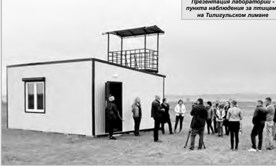
Презентация лаборатории пункта наблюдения за птицами на Тилгульском лимане

В этот день и на «8-м причале», и в Коблевуку все участники встречи много внимания уделяли