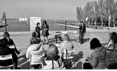
Встреча в Николаеве на «8-м причале»

Эксперты фиксируют, что в последние годы динамика загрязнения нашего моря значительно возросла. Являясь замкнутым бассейном, оно аккумулирует в себе загрязнители, которые приносятся водами Дуная, Днепра, Южного Буга, Днестра и других рек. Согласно данным исследователей, более 60% загрязняющих веществ Черного моря попадает именно с речными стоками — с территории 20 стран индустриальной Европы. Всего за 30 лет это привело к неоправданно изменению морской экосистемы.