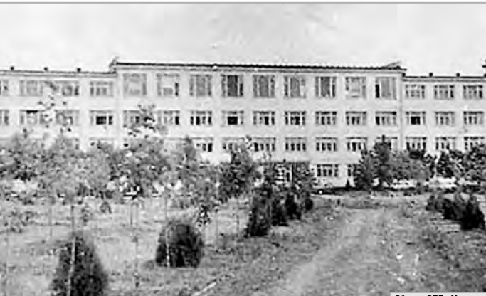
Здание СПб «Машпроект», 1963 г.