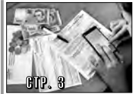
ТЕПЛО ПО ОСЕНИ СЧИТАЮТ СТР. 3

ПРОШЛОЕ И НАСТОЯЩЕЕ НАШЕГО ГОРОДА СТР. 7