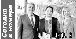
Сегодня в номере

Менеджер: А. Троянов Корректор: М. Погомыря