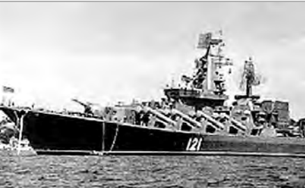
БПК с газовым реверсом