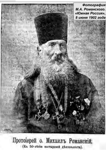
Фотографія М.А. Романовського. «Южная Россия», 8 июня 1902 года