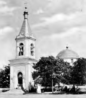
Открытие с видом Адмиралтейского собора, мая. XX века.

ордена Св. Анны 3-й и 2-й степеней; удостоен благословения Св. Правительствующего Синода; орденом Св. Владимира 4-й степени; знак Красного Креста; орденом Св. Владимира 3-й степени; золотой наперсный крест, пожалованный из кабинета Его Императорского Величества; палица; пожалованная Св. Правительствующим Синодом в память 50-летия священнослужения; Всемилостивейше пожалованное право возлагать при священнослужении митру; серебряная медаль за защиту Севастополя и бронзовая — в память войны 1853-1856 годов; бронзовый наперстный крест на Владимирской ленте в память той же войны и тёмнобронзовая медаль в память войны 1877-1878 годов.