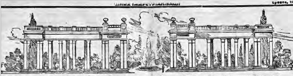
В идеальном же бытуйтону на Радянській площі на місці знесної царя гайтати буде збудовано велику колонаду з красивими архітектурними оформленнями. На малюнок проект колонади.