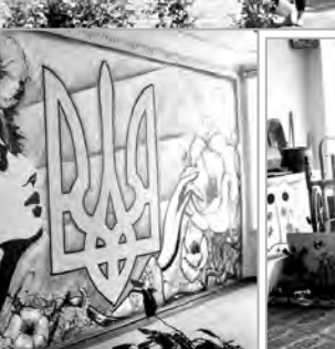
Школьный историко-краеведческий музей