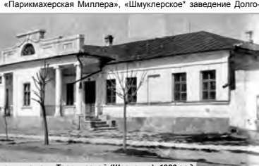
Дом Сировичинских на углу Таврической (Шевченко). 1930 год