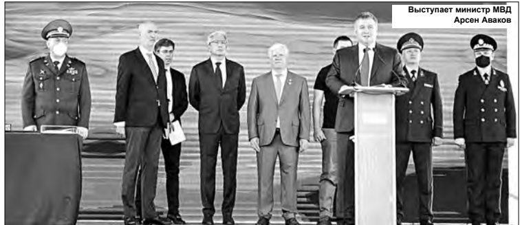
Выступает министр МВД Арсен Аваков

31 июля - кратковременный дождь, гроза. Ветер северо-западный, 5-10 м/с. Температура ночью +17...+22°C, днем +27...+32°C. 1 августа ночью - кратковременный дождь, гроза. Днем - без существенных осадков.