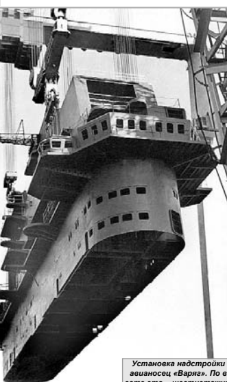
Установка надстройки на авианосце «Варг», по весу это - шестнадцатый дом, массой ок. 1000 тонн

ми 150-метровыми порталами и стпелями, и предстальной площадкой. А в годы правления, действительно, один из главных показателей мощности и масштаба судостроительного предприятия. Американцы только сейчас подходят к технологиям сборки, которые мы освоили 30-35 лет назад. Авианосцы «Адмирал Кузнецов», «Варг» и «Ульяновск» собирались из 24-х крупных блоков с насыщением их всем возможным оборудованием до установки на стпель. Новые технологии заключались еще при проектировании авианосца - чертежи выпускались на 24 полностью готовые технологические единицы. Еще три блока составляли угловую полетную палубу - спонсон. Это был прорыв в технологиях сборки корабля, под которым менялись и со-