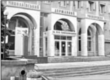
Центр международных проектов «Сверсоисвита», в партнерстве с международной группой экспертов IREG Observatory on Academic Ranking and