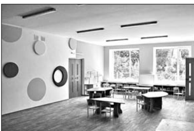
вателі — педагоги ДНЗ №87 відчиняють диточкам двері в суспільне життя та допомагають зробити їм перший крок від

Дошкільний навчальний заклад працює за базовою програмою розвитку дитини дошкільного віку, яка передбачає гармонійний та різнобічний розвиток малечі, формування особистості. Досвідчені вико-