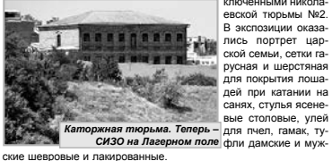
Каторжная тюрьма. Теперь — СИЗО на Гаверном поле

В 1911 году в Царском Селе состоялась ремесленная выставка, на которой были представлены экспонаты, изготовленные заключенными николаевской тюрьмы №2.