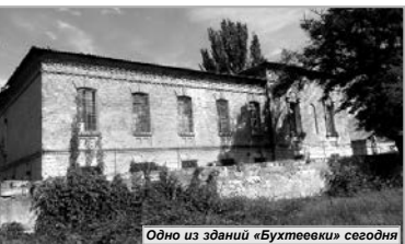
Одно из зданий «Бухтеевки» сегодня

В 1920-е годы советская власть хотела уничтожить «Бухтеевку» как символ самодержавия и открыть «на обломках самодержавия» рабочий клуб, но в итоге разместил «реформаториум для беспризорных». В дальнейшем тюремные флигели для чего только не использовались! Были здесь курсы трактористов, клубная Союза металлистов, воинская часть, школа... Практически все помещения «Бухтеевки» сохранились до наших дней. Из-за старого забора кое-где «выглядывают» неплохо сохранившиеся краснокирпичные здания со скромными элементами архитектурного декора. Сегодня на территории расположено воинская часть. Приведено в порядок двухэтажное здание бывшей жандармерии (памятник архитектуры местного значения) — и теперь тут находится детская музыкальная школа №8.