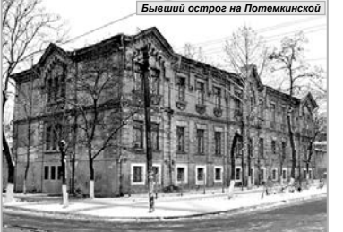
Бывший острог на Потемкинской

Во время работы в архивах в руки Игоря Гаврилова попадали немало любопытных документов, которые позволяют представить особенности тюремного патриархального быта позарешовского века. Жизнь на окраинной, полусельской слободе в начале XIX века текла неспешно, расслабленно. Заключенные могли выходить из своих камер в тюремный двор, вместе с охранниками курили, устраивали пышки и звали на свои посиделки девушек свободного поведения. Местное население жаловалось: по ночам со стороны острога доносятся ясные крики,