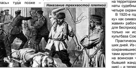
Наказание трезехостной пяткой

Нужно отметить еще одно замечательное «место заключения» — гауптвахту, расположенную на Соборной площади как раз напротив Городской Думы. В этом здании, построенном в конце XVIII века, поначалу находился городской магистрат. Гауптвахта «вселилась» туда позже —