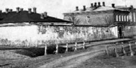
«Бухтеевка». 1915 год.

Создать новый проект «Бухтеевки» поручили городскому архитектору Константину Петровичу Паризо де ла Валетту. Объем работ предстоял солидный: построить новый двухэтажный корпус, отремонтировать два флигеля для надзирателей, провести реконструкцию в одном из помещений для открытия там тюремной церкви во имя Святого Антония и Первоученика архидиакона Стефана, пристроить баню, прачечную, замостить хозяйственный двор... Денег были выделены немалые, и достаточное финансирование позволило оборудовать здания с использованием передовых для того времени технологий: в тюрьме провели водопровод, люфтовую канализацию, отопление, электрическое освещение.