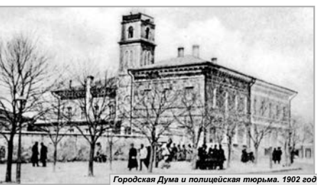
Городская Дума и полицейская тюрьма. 1902 год

Затем в 1828 году новые здания — с лазаретом и церковью — спроектировал городской архитектор Федор Иванович Вунш. Третий этап модернизации тюрьмы приходится на 1903-1910 годы.