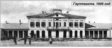
Гауптвахта. 1906 год