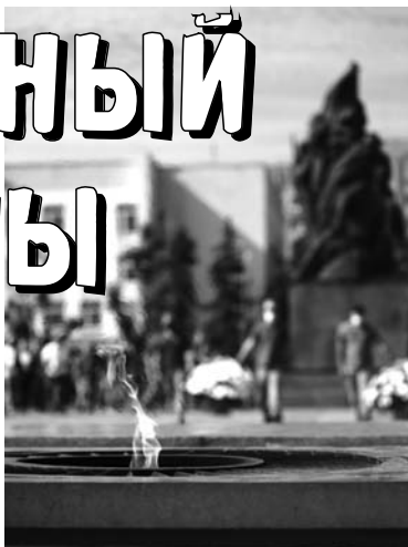
Тот самый длинный день в году С его безоблачной погодой Принес нам общую беду Одну на всех, на все четыре века Константин Симонов.