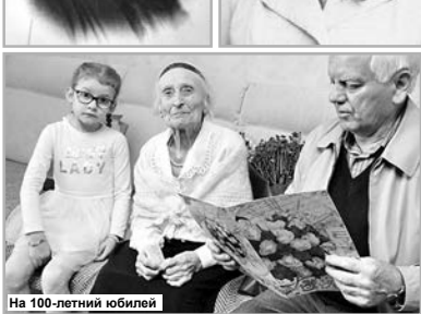
На 100-летний юбилей

«Подольно-партизанское движение на Николаевщине в годы Великой Отечественной войны. 1941-1944 годы» (создан в 1975 г.) и уникальный музей судостроения и флота (создан в 1978 г.).