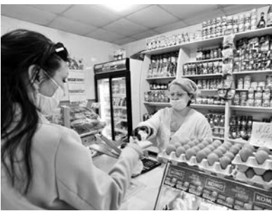
1 мая в Николаеве после длительного простоя из-за общенационального карантина открылись продовольственные ряды Центрального рынка, рынков «Колос», «Клаксон», «Площадь Победы», «Украина» и ряда других.