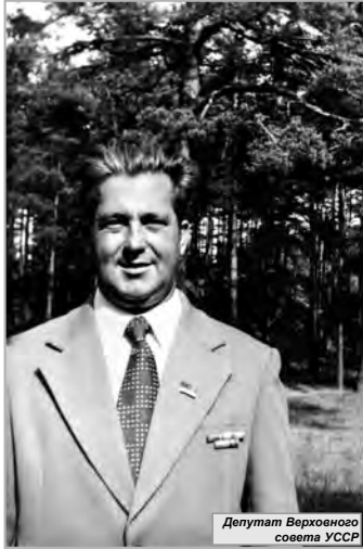
Депутат Верховного совета УССР