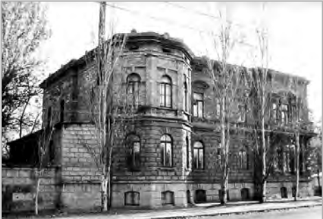
Фотография 1989 года