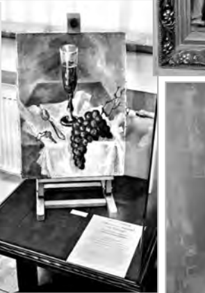
Это рассказ о николаевских художницах и скульпторах, о мастерах старшего и среднего поколений...