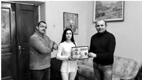
фотографа с героями, столь важного для создания удачных снимков!