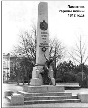
Памятник героям войны 1812 года