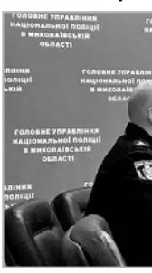
Об этом говорят