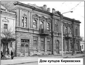
Дом купцов Киреевских

И вообще, весь «квартальный квартал» по правую сторону «Бульварной-Адмиральской-Артиллерийской-Набережная» - это были земли Морского ведомства с домом главного командира в центре и прочими мелкими постройками на территории. Здесь практически ничего не строилось вплоть до Первой мировой войны.