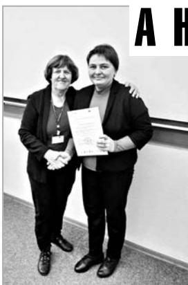
26-27 ноября 2019 года в Николаевском национальном университете имени В. А. Сухомилинского прошла Международная конференция по про-