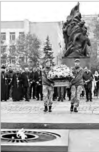
28 октября наша страна отмечала День освобождения Украины от фашистских захватчиков. Именно в этот день в конце октября 1944 года с украинской земли был изгнан последний солдат нацистского рейха.

Во время Второй мировой войны (1939-1945) на территории Украины проходили битвы, многие из которых имели особое значение для освобождения Европы от нацизма и непосредственным образом влияли на ход боевых действий. Наш южный портюв, кораблестроительный город также сыграл