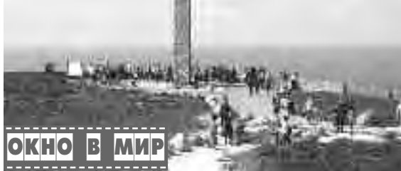
ОКНО В МИР