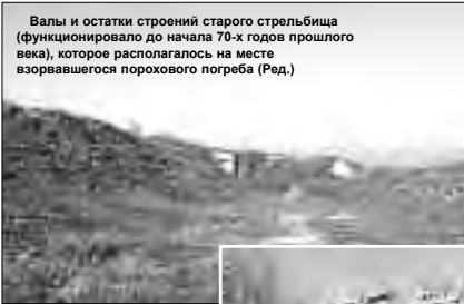
Валы и остатки створений старого стрельбища (функционировало до начала 70-х годов прошлого века), которое располагалось на месте возвращаемого порохового погреба (Р.Е.)