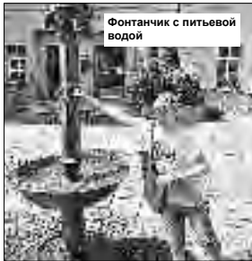
Фонтанчик с питьевой водой

Интересен и сам погребальный ритуал. При входе гроба в церковь герольд из похоронной процессии стучал в ворота, а монах-настоятель спраши-