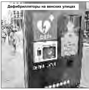
Дефибрилляторы на венских улицах

Согласно легенде, Ополое получил свое название благодаря Казимежу I Опольскому, который, проезжая в этих краях, воскликнул: «О, поле!». Это город типичной европейской архитектуры средневековья и нового времени. А все, что строится нового, гармонично сочетается с историческими зданиями, с тем, что уже есть. Среди местных «обновок» прекрасное новоисторичное здание филармонии (чего крайне не хватало Николаеву), почукие светомузыкальные фонтаны посреди неболь-