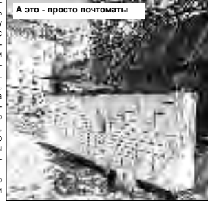
А это - просто почтотоматы

Подняться на башню собора Дуомо оказалось дорого – по 23 евро с человека. Зато рядом недорогой по европейским меркам «Макдоналдс» – «Биг-Мак меню» за 4.90. И с отличной от нашей «Фанты», сильно напоминающей натуральный цитрусовый сок, слегка разбавленный водой. Также же меню в Барселоне обходится вам в 7.50, а в Париже, в подземном центре «Карусель» под Лувром, и вовсе в 14 евро. Правда, не с одним, а с двумя «Биг-Маками».