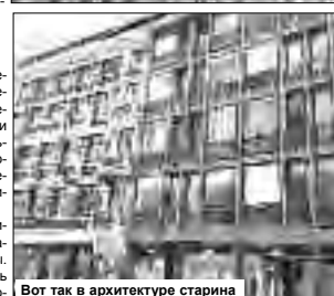
Вот так в архитектуре старинно уживается с современностью

Попробовали фирменное итальянское мороженое джелато. Как на наш вкус, оно оказалось невыносимо сладким. Зато его можно бесплатно запить в городе полно то ли биевоты, то ли просто водопроводных кранов с питьевой водой.