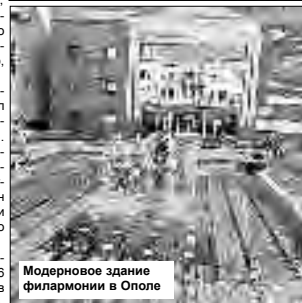
Современное здание филармонии в Ополое