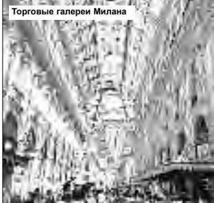
Торговые галереи Милана

шого озера у ресторана «Жимске вакацие» (Римские каникулы). Впрочем, тут можно найти и явные следы глобализации, например, в форме сетевых ливийских кебаб-кафе «Триполи», супермаркетов и прочего.