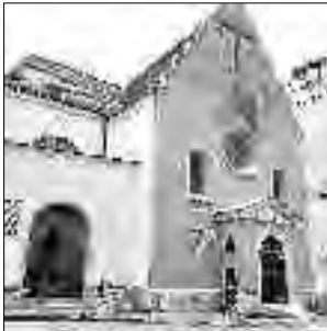
Строгая Капучинеркирхе - усыпальница Габсбургов

Говорят, в коммуне Венеция с учетом материковой части живет около 250 тыс. человек, а на самих островах – 60 тыс. Честно говоря, трудно представить, как они тут живут. Тут хорошо пожить несколько дней как туристу. Потом тебе эта экзотика осточертеет и можно съезжаться. А как быть местному жите-