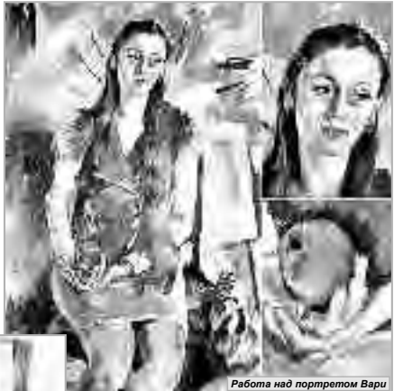
Работа над портретом Вари